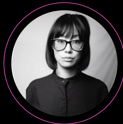
Rita Wu: apresentadora da CNN e pesquisadora de tecnologia