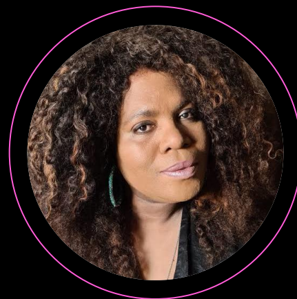
Clodd Dias: atriz de grandes produções, como "Manhãs de Setembro", "As Five" e "Rodeio Rock"