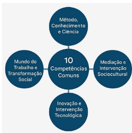
Parâmetros Nacionais - Itinerários Formativos de

Assim, para o Ensino Médio Técnico e Profissional, considerando o preposto, orienta-se a sistematização dos Eixos Estruturantes “Mundo do Trabalho e Transformação Social” e “Inovação e Intervenção Tecnológica”, organizada pela distribuição de Atribuições Empreendedoras aplicadas às nomenclaturas funcionais de Planejamento, Execução e Controle, bem como às Áreas de Ação Empreendedora de Análise e Planejamento, Ações Comportamentais e Atitudinais, Liderança, Integração Social, Criatividade e Inovação, estruturadas e em alinhamento direto com as Dez Competências Gerais dos Itinerários Formativos, como segue: