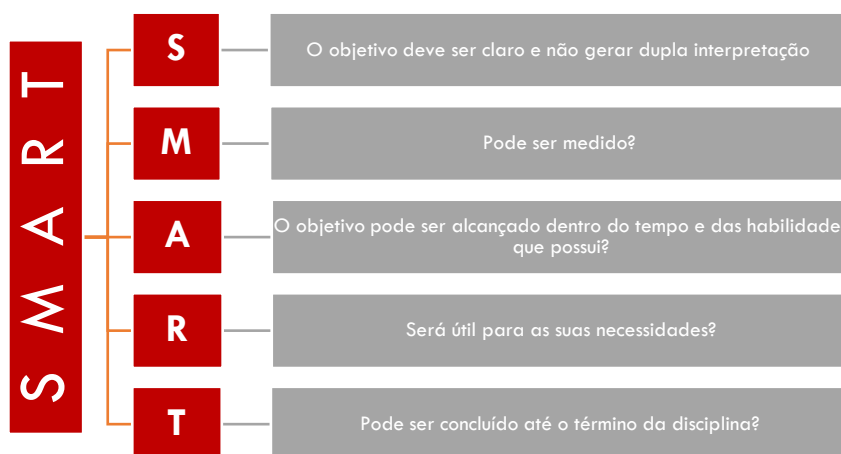
Figura 1 – Ferramenta SMART

Os objetivos de cada um dos Projetos Integradores devem se pautar nas competências a serem desenvolvidas nas disciplinas relacionadas ao PI, sempre focado no desenvolvimento socioemocional, ou seja, a complexidade e abrangência dos projetos devem ser compatíveis com os objetivos de aprendizagem dessas disciplinas. Para auxiliar na definição dos objetivos, sugere-se o emprego da Ferramenta SMART, apresentada na figura 1. Esta ferramenta é muito utilizada na gerência de projetos e pode ser útil no desenvolvimento dos PIs.