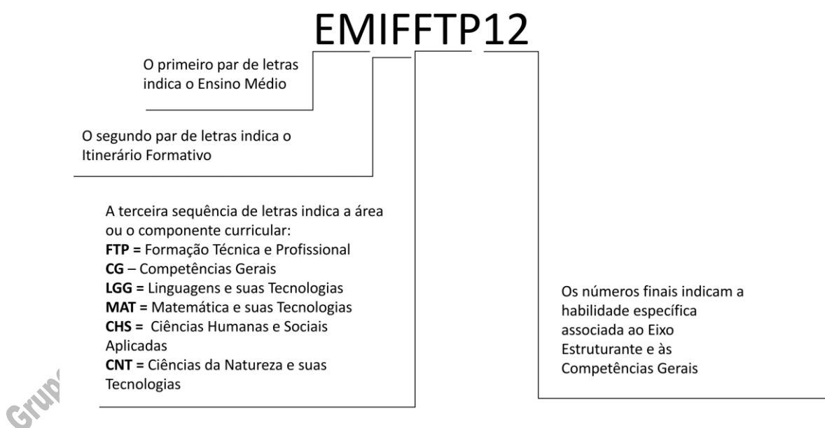
Gráfico explicativo do Código de Habilidade da Formação Técnica Profissional – FTP

A distribuição das habilidades indicadas acima ocorre em conformidade com a correlação entre estas habilidades e as atribuições empreendedoras, apresentada nos Componentes Curriculares em que as atribuições correlatas forem alocadas, cumprindo, dessa forma, a função prevista pelos Eixos Estruturantes.