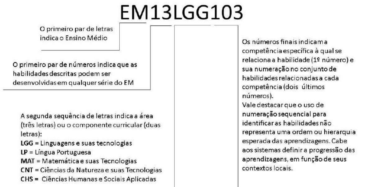
Gráfico do código alfanumérico para as Habilidades da Formação Geral Básica