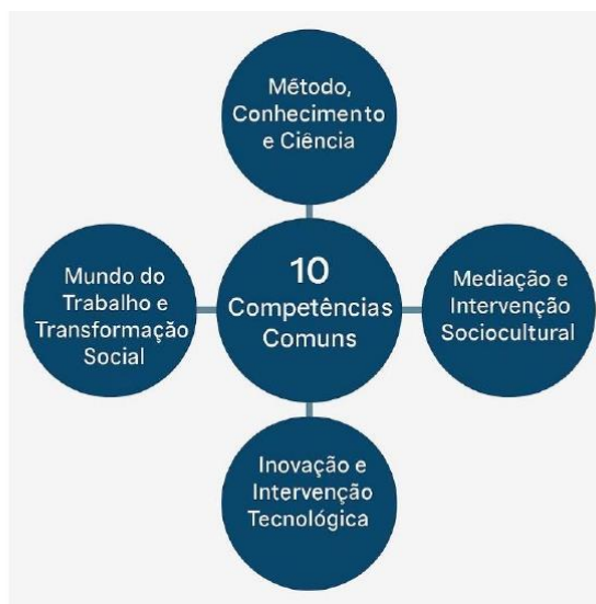
Parâmetros Nacionais - Itinerários Formativos de

Assim, para o Ensino Médio Técnico e Profissional, considerando o preposto, orienta-se a sistematização dos Eixos Estruturantes “Mundo do Trabalho e Transformação Social” e “Inovação e Intervenção Tecnológica”, organizada pela distribuição de Atribuições Empreendedoras aplicadas às nomenclaturas funcionais de Planejamento, Execução e Controle, bem como às Áreas de Ação Empreendedora de Análise e Planejamento, Ações Comportamentais e Atitudinais, Liderança, Integração Social, Criatividade e Inovação, estruturadas e em alinhamento direto com as Dez Competências Gerais dos Itinerários Formativos, como segue: