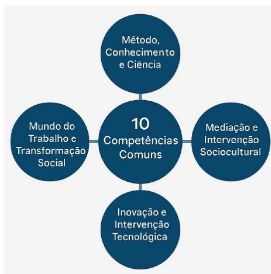
Parâmetros Nacionais - Itinerários Formativos de

Assim, para o Ensino Médio Técnico e Profissional, considerando o preposto, orienta-se a sistematização dos Eixos Estruturantes “Mundo do Trabalho e Transformação Social” e “Inovação e Intervenção Tecnológica”, organizada pela distribuição de Atribuições Empreendedoras aplicadas às nomenclaturas funcionais de Planejamento, Execução e Controle, bem como às Áreas de Ação Empreendedora de Análise e Planejamento, Ações Comportamentais e Atitudinais, Liderança, Integração Social, Criatividade e Inovação, estruturadas e em alinhamento direto com as Dez Competências Gerais dos Itinerários Formativos, como segue: