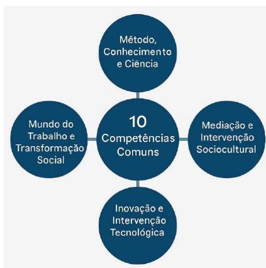
Parâmetros Nacionais - Itinerários Formativos de

Assim, para o Ensino Médio Técnico e Profissional, considerando o preposto, orienta-se a sistematização dos Eixos Estruturantes “Mundo do Trabalho e Transformação Social” e “Inovação e Intervenção Tecnológica”, organizada pela distribuição de Atribuições Empreendedoras aplicadas às nomenclaturas funcionais de Planejamento, Execução e Controle, bem como às Áreas de Ação Empreendedora de Análise e Planejamento, Ações Comportamentais e Atitudinais, Liderança, Integração Social, Criatividade e Inovação, estruturadas e em alinhamento direto com as Dez Competências Gerais dos Itinerários Formativos, como segue: