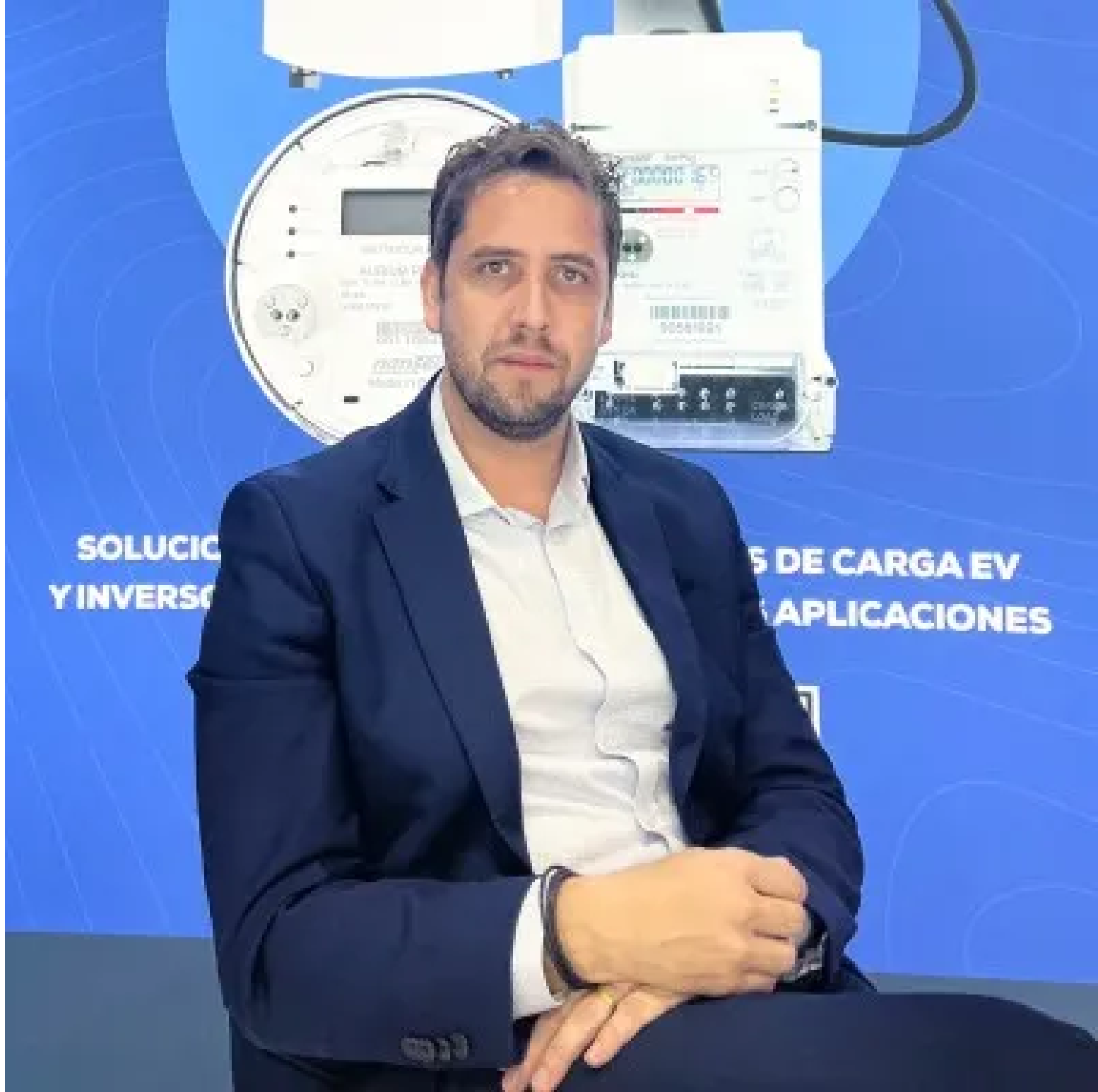
Nansen participa de projetos de mobilidade elétrica no Paraná, Amazonas e Brasília