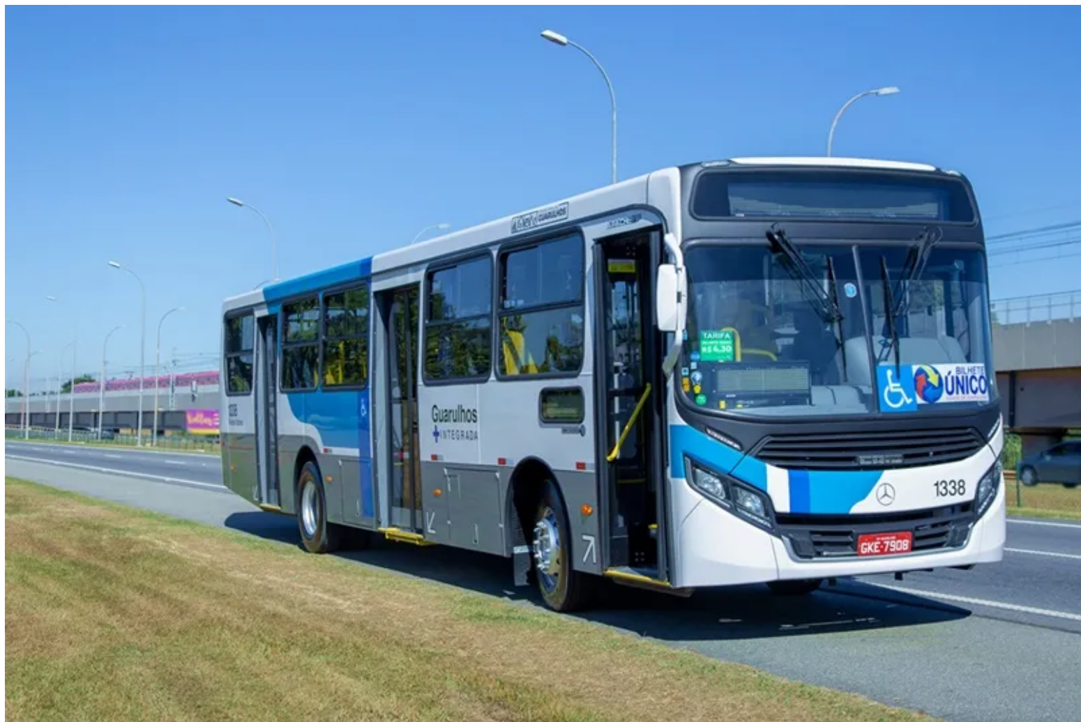
Plataforma da Optibus é adotada pelo Grupo Niff, responsável por diversas operações no estado de São Paulo