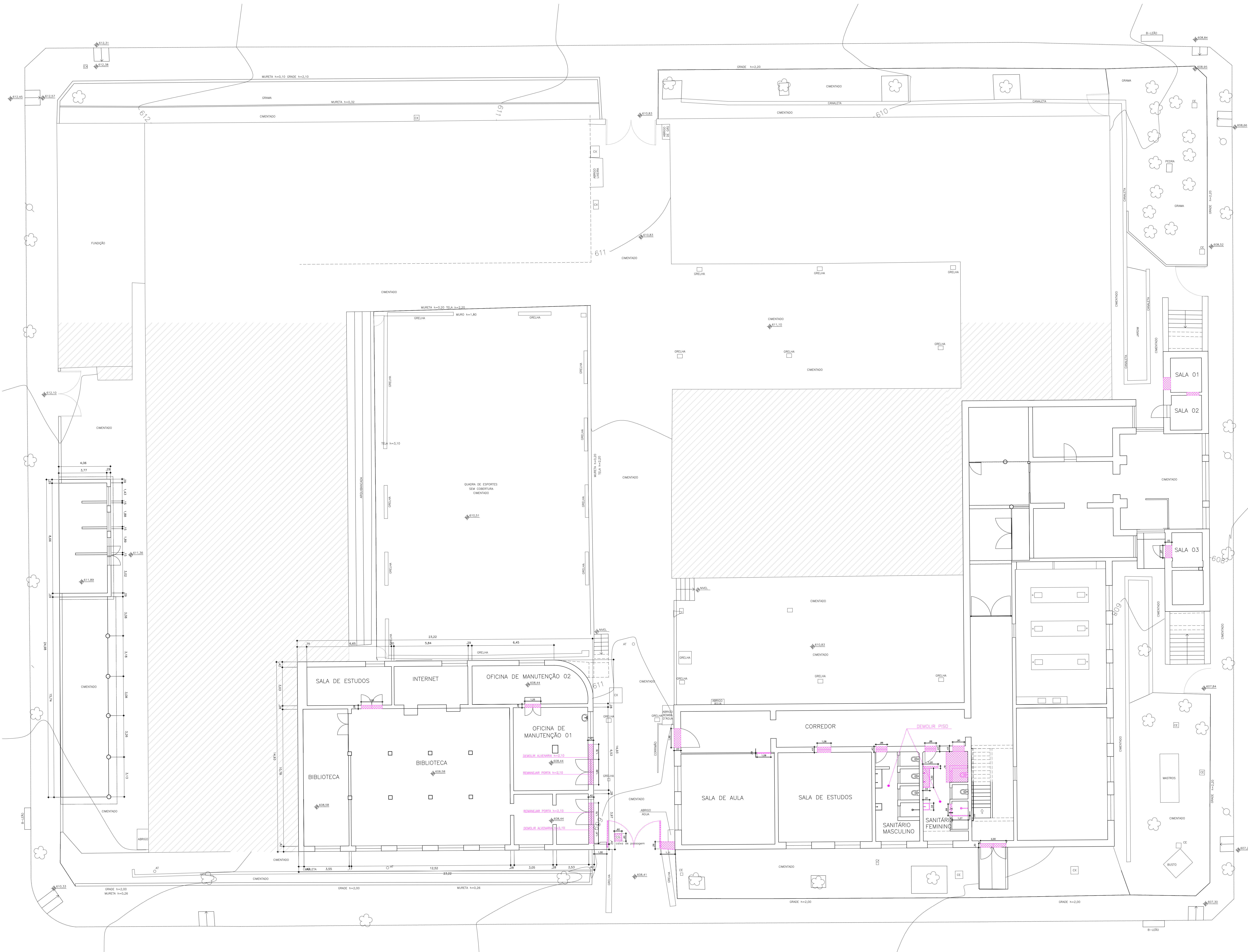
PLANTA PAVIMENTO TÉRREO ESC. 1:100