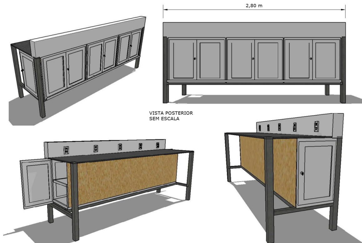
VISTA POSTERIOR SEM ESCALA