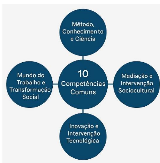
Parâmetros Nacionais - Itinerários Formativos de

Assim, para o Ensino Médio Técnico e Profissional, considerando o preposto, orienta-se a sistematização dos Eixos Estruturantes “Mundo do Trabalho e Transformação Social” e “Inovação e Intervenção Tecnológica”, organizada pela distribuição de Atribuições Empreendedoras aplicadas às nomenclaturas funcionais de Planejamento, Execução e Controle, bem como às Áreas de Ação Empreendedora de Análise e Planejamento, Ações Comportamentais e Atitudinais, Liderança, Integração Social, Criatividade e Inovação, estruturadas e em alinhamento direto com as Dez Competências Gerais dos Itinerários Formativos, como segue: