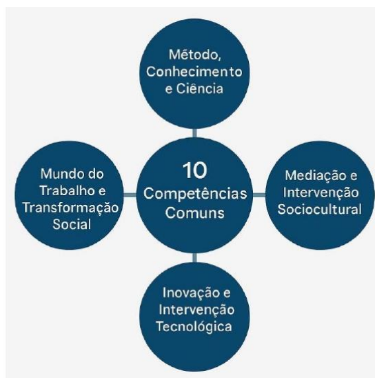
Parâmetros Nacionais - Itinerários Formativos de

Assim, para o Ensino Médio Técnico e Profissional, considerando o preposto, orienta-se a sistematização dos Eixos Estruturantes “Mundo do Trabalho e Transformação Social” e “Inovação e Intervenção Tecnológica”, organizada pela distribuição de Atribuições Empreendedoras aplicadas às nomenclaturas funcionais de Planejamento, Execução e Controle, bem como às Áreas de Ação Empreendedora de Análise e Planejamento, Ações Comportamentais e Atitudinais, Liderança, Integração Social, Criatividade e Inovação, estruturadas e em alinhamento direto com as Dez Competências Gerais dos Itinerários Formativos, como segue: