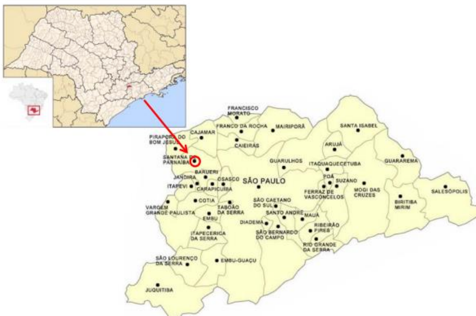
Localização de Santana de Parnaíba

A cidade de Santana de Parnaíba está localizada na Mesorregião Metropolitana de São Paulo e Microrregião de Osasco, com 180,39 Km 2 e 108.813 habitantes segundo Censo de 2010.