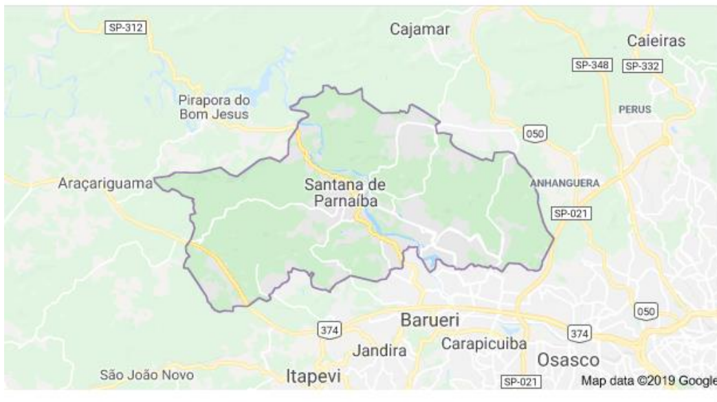
Mapa de Santana de Parnaíba

Segundo INGE, entre 2000 e 2010, a população de Santana de Parnaíba cresceu a uma taxa média anual de 3,82%, enquanto no Brasil foi de 1,17%, no mesmo período. Entre 2000 e 2010, a razão de dependência no município passou de 51,73% para 41,54%. Representando aumento da população econômica ativa. Já na UF, a razão de dependência passou de 65,43% em 1991, para 54,88% em 2000 e 45,87% em 2010. Em 1991, esses dois indicadores eram, respectivamente, 69,14% e 2,34%.