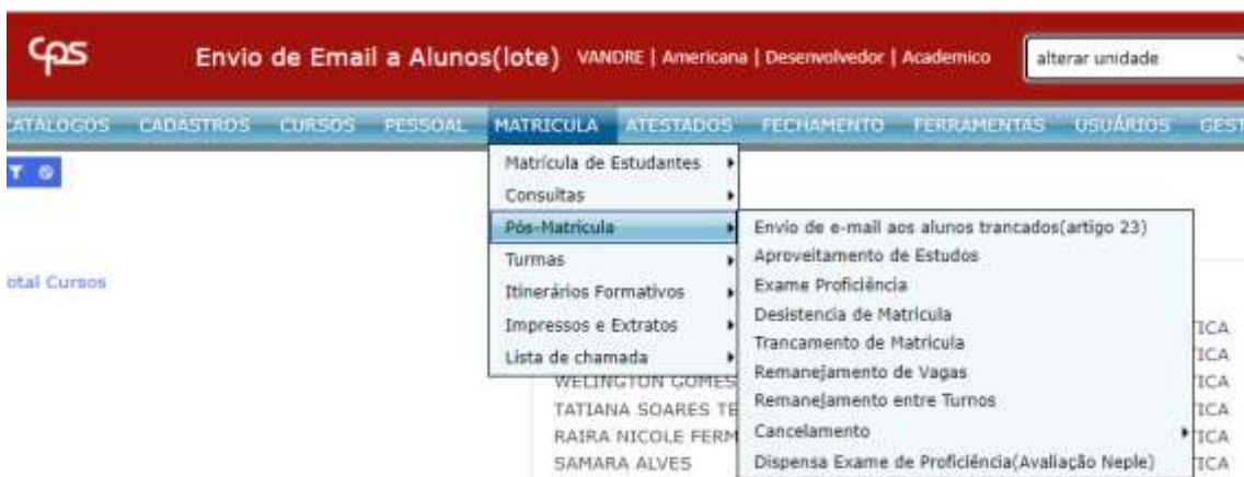
Figura 1: Menu de acesso (Diretor de serviços acadêmico)

Ao ingressar no Siga Fatec, o Diretor de Serviços Acadêmicos deverá acessar o menu, conforme ilustra a imagem abaixo: