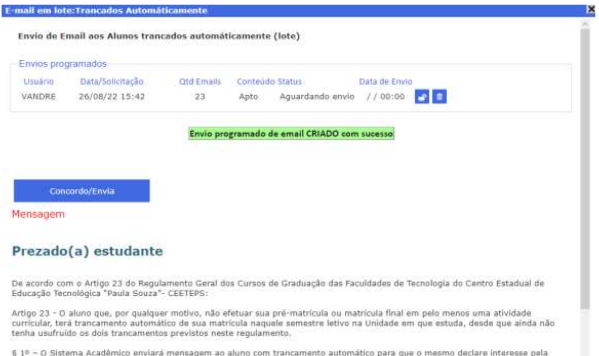
Figura 5. Envio programado de email inserido.