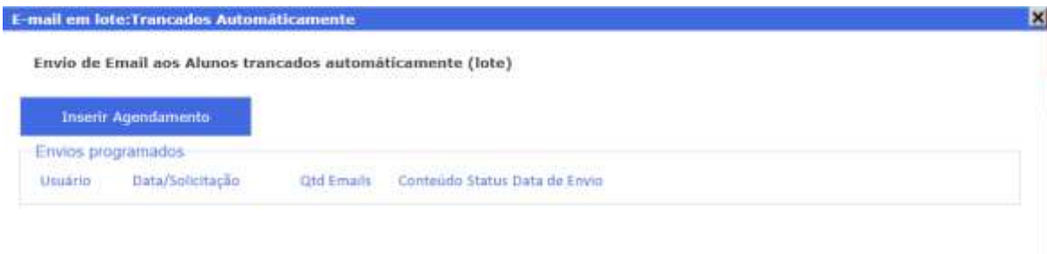
Figura 4: Interface de envio de e-mail programado

A interface possibilita gerar um agendamento de envio de e-mail que será executado em outro momento com o objetivo de não sobrecarregar o servidor e que todos os e-mails sejam efetivamente enviados. Para isso basta clicar em Inserir agendamento para criar um registro contendo todos os e-mails dos alunos trancados pelo artigo 23.