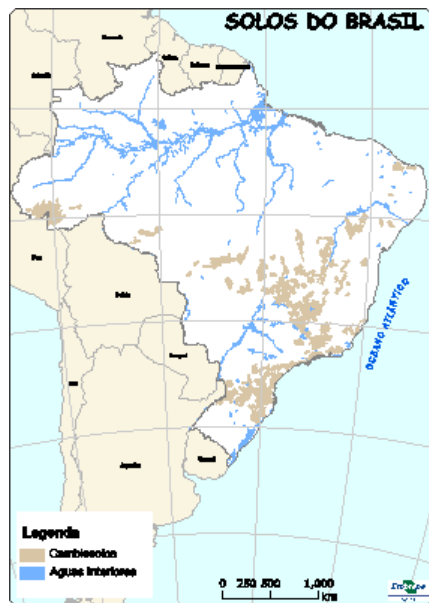
Figura 2: Ocorrência de Cambissolos no Brasil