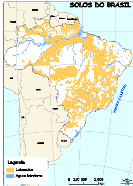
Figura 7: Ocorrência de Latossolos no Brasil.