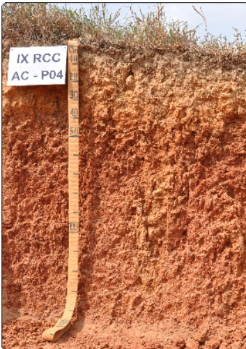
Foto 1: Sebastião Barreiros Calderano. Local: Cruzeiro do Sul-AC. Material de Origem: sedimentos argilo-arenosos da Formação Solimões Inferior.