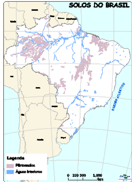
Figura 13: Ocorrência de Plintossolos no Brasil.