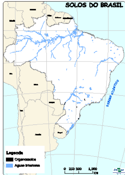
Figura 11: Ocorrência de Organossolos no Brasil.