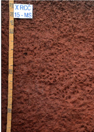
Foto 10: Local: Bodoquena-MS. Material de Origem: produtos da alteração de calcários.