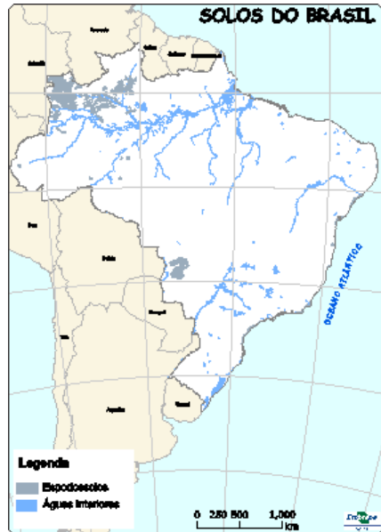
Figura 5: Ocorrência de Espodosolos no Brasil.

Material de Origem: sedimentos arenosos marinhos.