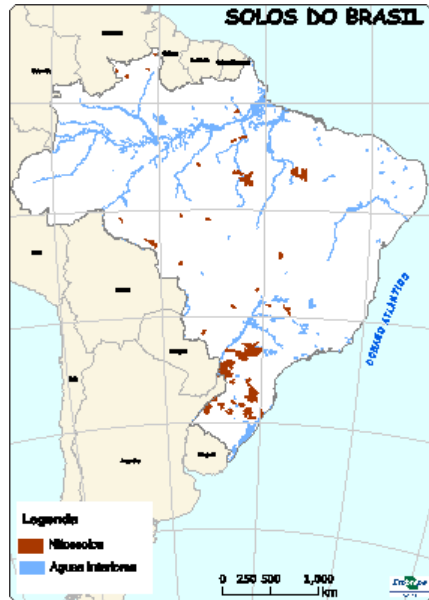
Figura 10: Ocorrência de Nitossolos no Brasil. Fonte: Santos et al.(2013b).