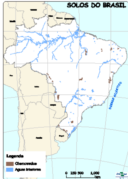
Figura 3: Ocorrência de Chernossolos no Brasil.