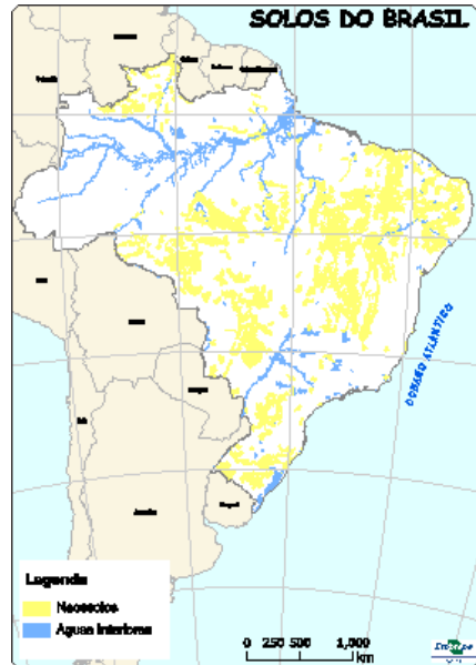
Figura 9: Ocorrência de Neossolos no Brasil. Fonte: Santos et al.(2013b).