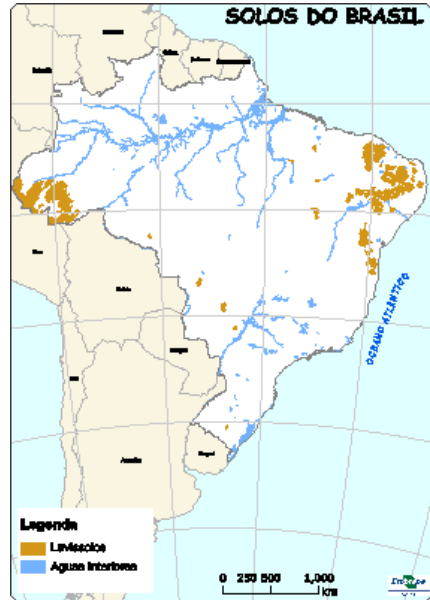
Figura 8: Ocorrência de Luvissolos no Brasil.