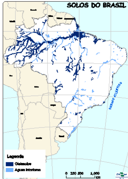
Figura 6: Ocorrência de Gleissolos no Brasil.