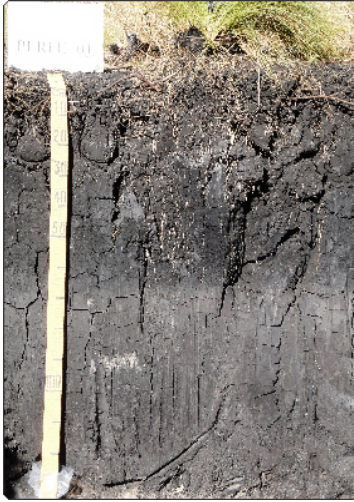
Foto 11: Ademir Fontana. Local: Indianópolis-MG. Material de Origem: depósitos orgânicos.