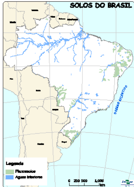
Figura 12: Ocorrência de Planossolos no Brasil.