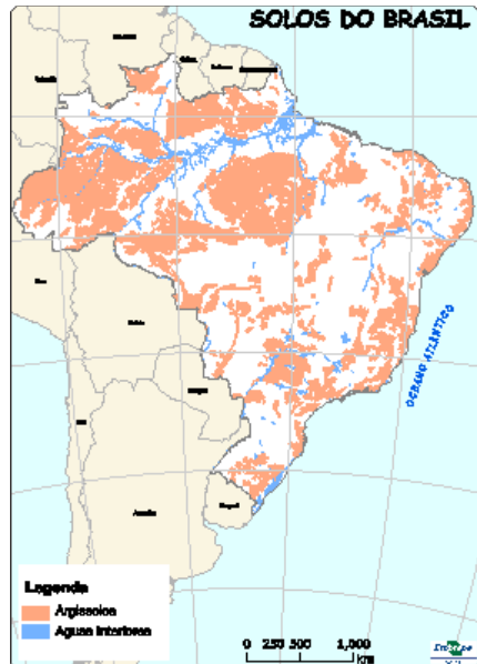
Figura 1 : Ocorrência de Argissolos no Brasil. Fonte: Santos et al.(2013b).