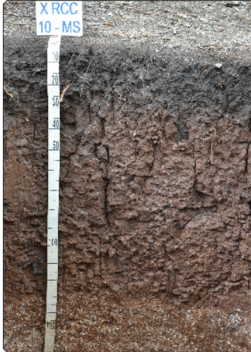
Foto 14: Local: Corumbá-MS. Material de Origem: produtos da alteração de calcário.