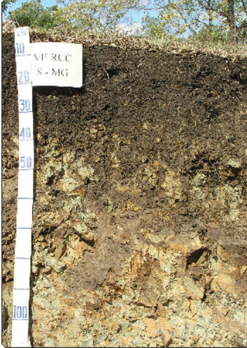
Foto 9: Maria de Lourdes Mendonça Santos. Local: Lagoa Formosa-MG. Material de Origem: produtos da decomposição de tufitos.