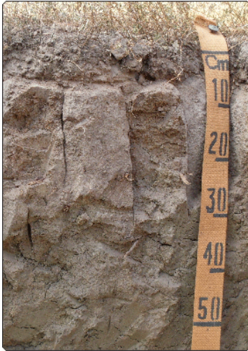
Foto 12: José Coelho de Araújo Filho. Local: Município de Quixadá-CE. Material de Origem: produtos de decomposição de gnaisses e granitos.