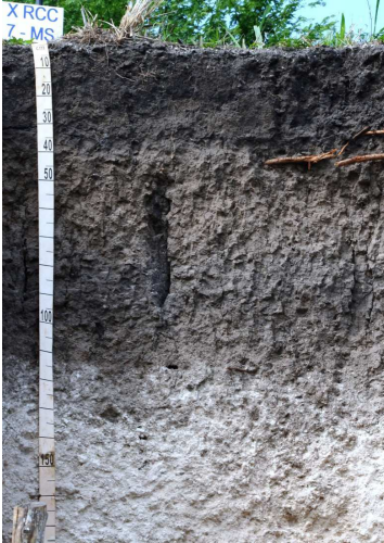
Foto 3: Local: Corumbá - MS. Material de Origem: produtos da alteração de tufas calcárias.