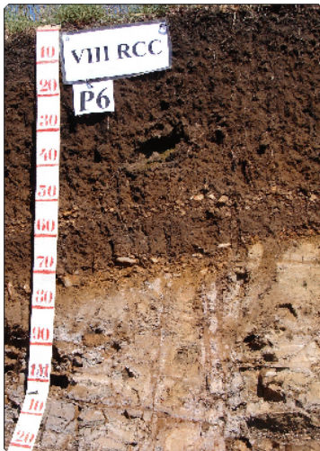
Foto 2: Marcos Gervasio Pereira. Local: Água Doce-SC. Material de Origem: produtos da decomposição de riódacitos.