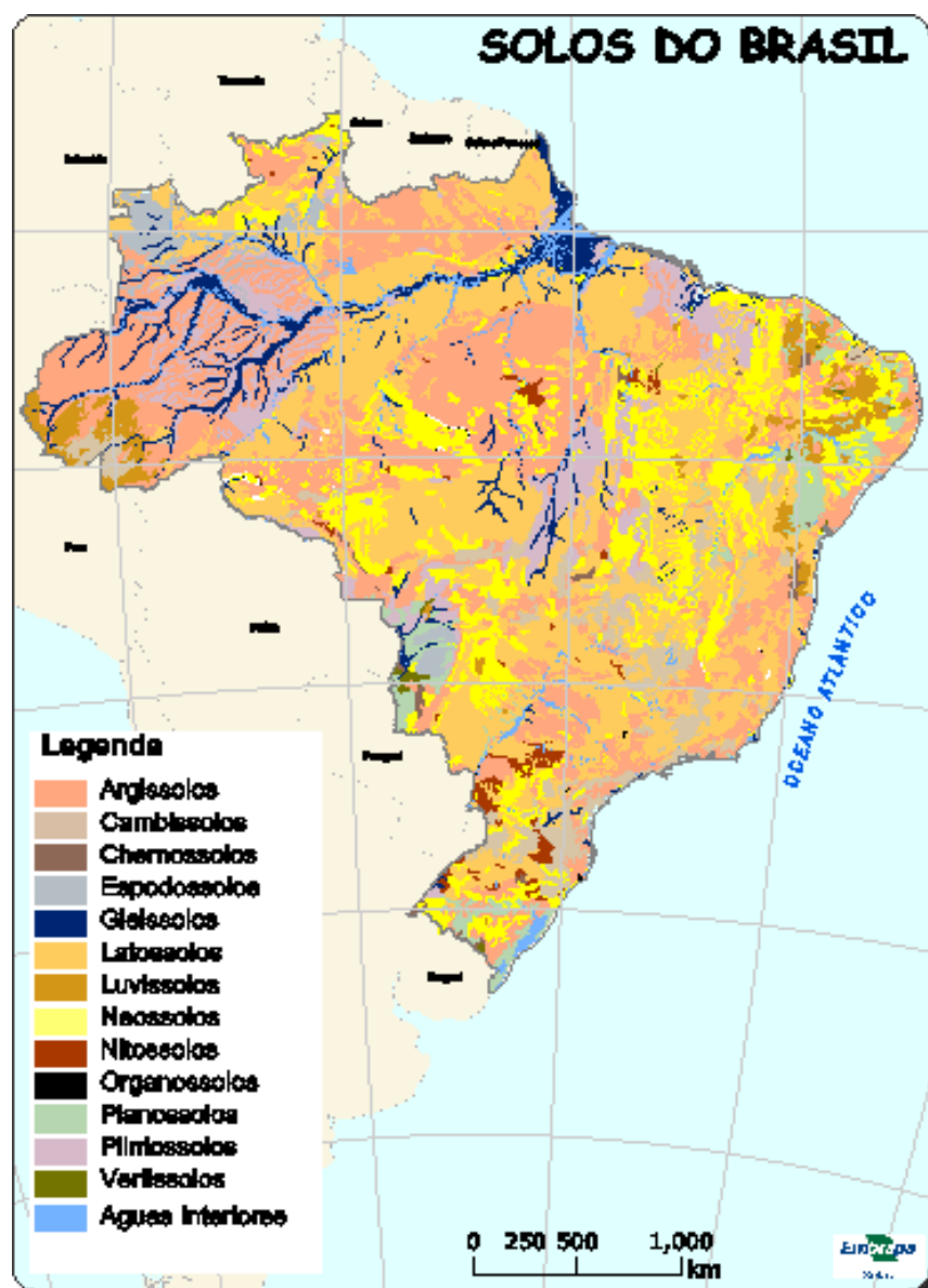
Classificação de Solos no território Brasileiro