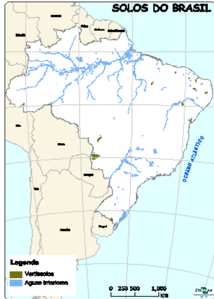
Figura 14: Ocorrência de Vertissolos no Brasil. Fonte: Santos et al.(2013b).