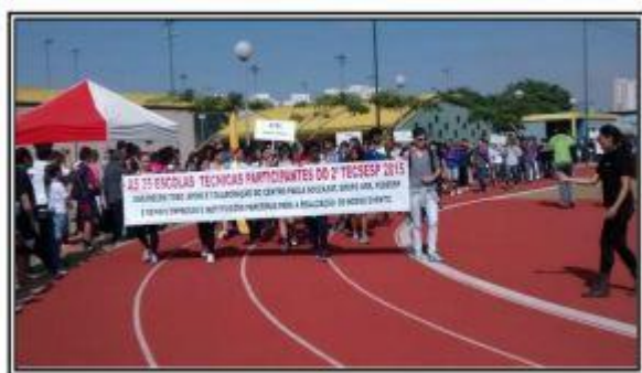
Desfile de Abertura TECSESP

Pensando na responsabilidade socioambiental a Unidade continuará o Projeto TECSESP 2016 com a ideia de fortalecer a integração da escola com a comunidade local e, com isso, buscar novas parcerias para a organização do evento nas diversas modalidades esportivas. O intuito deste projeto, entre outros, concerne em estimular a sociabilização e propiciar a interação harmoniosa nas demais Escolas Técnicas de cursos e perfis diferentes, auxiliando no convívio social, no conhecimento e relacionamento com um grupo heterogêneo. Analisando as várias edições, percebeu-se que esse evento é primordial não só para a ETEC de Esportes Curt Walter Otto Baumgart, mas também para todas as escolas participantes, pois além de contribuir para a harmonia das escolas técnicas, possibilita grandes e inesquecíveis experiências a alunos e professores. Com a coleta de alimentos não perecíveis espera-se alcançar o auxílio a diversas entidades assistenciais.