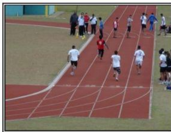
2015 Atletismo TECSESP 2015