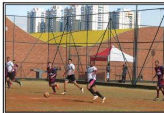
Futsal Masculino TECSESP 2015