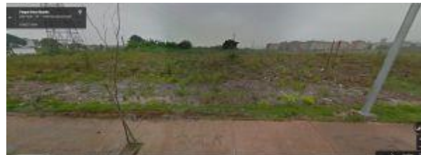
Desocupação do terreno