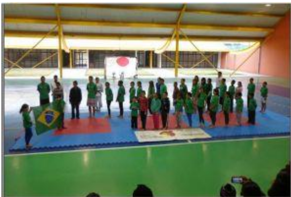
Atividades ETEC na Comunidade

Os projetos desenvolvidos na Unidade Escolar fazem parte de uma proposta de abranger a Comunidade num todo envolvendo alunos, docentes, funcionários, pais e todo corpo diretivo em acompanhar as etapas e procedimentos adotados no percurso de seu desenvolvimento. Além é claro, de atender a comunidade local, por meio do projeto denominado “Etec na Comunidade”, uma parceria com a Secretaria de Esporte, Lazer e Juventude do Estado de São Paulo e ABRAPEFE (Associação Brasileira dos Profissionais de Educação Física e Esporte).