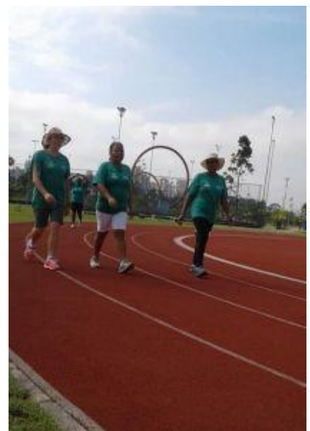
Atividades ETEC na Comunidade