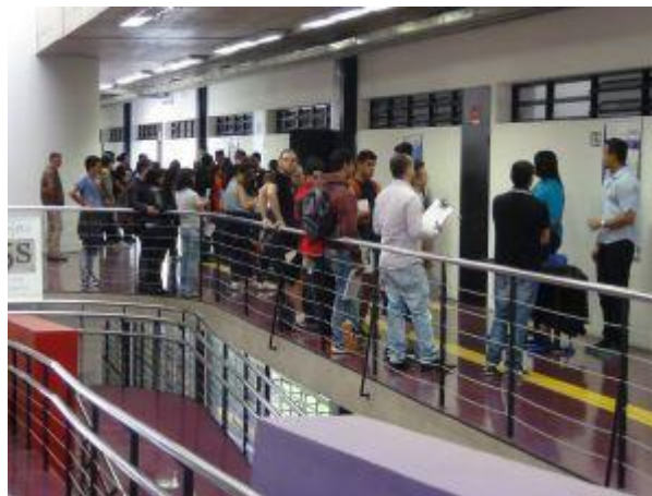
Apresentação TCC 2º Semestre de 2015

A Unidade de Ensino concede grande atenção ao Trabalho de Conclusão de Curso (TCC), o TCC traz a oportunidade de uma formação profissional pautada na interação da teoria com a prática e privilegia o aprender por meio do fazer. Uma prática de apresentação diferenciada foi inaugurada no 2º semestre de 2015, e os resultados foram muito bons; os alunos apresentaram os trabalhos de maneira mais prática, por meio de um workshop/feira, utilizando banners e práticas diferenciadas para apresentação do tema, esses se mostraram mais motivados e seguros na apresentação e a comunidade escolar conseguiu participar de maneira mais profunda da proposta de cada trabalho, alcançando melhor compreensão sobre cada assunto desenvolvido. Tal prática será aplicada no ano de 2016.