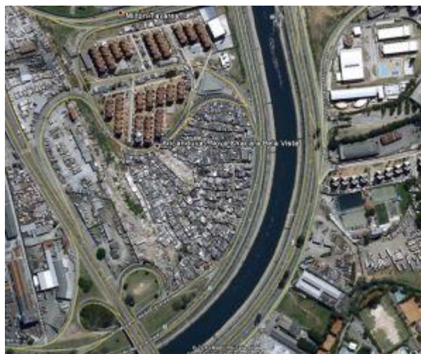
Vista aérea do terreno quando era ocupado por uma comunidade carente

O terreno onde se encontra hoje a Escola já serviu de moradia para aproximadamente oito mil pessoas e por um tempo ficou inutilizado. Até a construção e inauguração da Unidade a região era atendida por uma linha de ônibus e hoje, pelas parcerias e pelo trabalho reconhecido da Unidade, já possui mais três linhas, totalizando quatro itinerários.