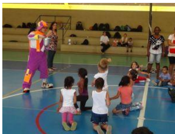
Atividade Prática: Esportes Radicais