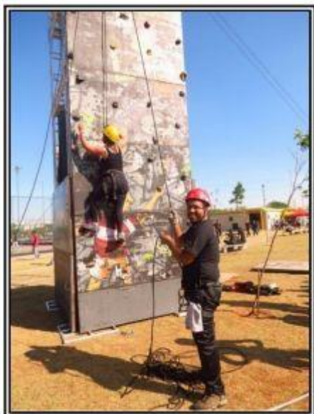
Escalada TECSESP 2015