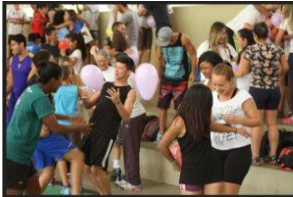
Atividades de Integração 2015

Outra ação relevante na ETEC de Esportes é a integração realizada todo semestre com todas as turmas do curso técnico, alunos, professores, servidores administrativos, equipe de coordenação, orientação e direção participam de atividades integradoras, essa ação além de colaborar para o aumento de laços entre toda a equipe, também permite uma visão diferenciada e positiva aos alunos do 1º semestre, que já se sentem parte da Unidade de Ensino.