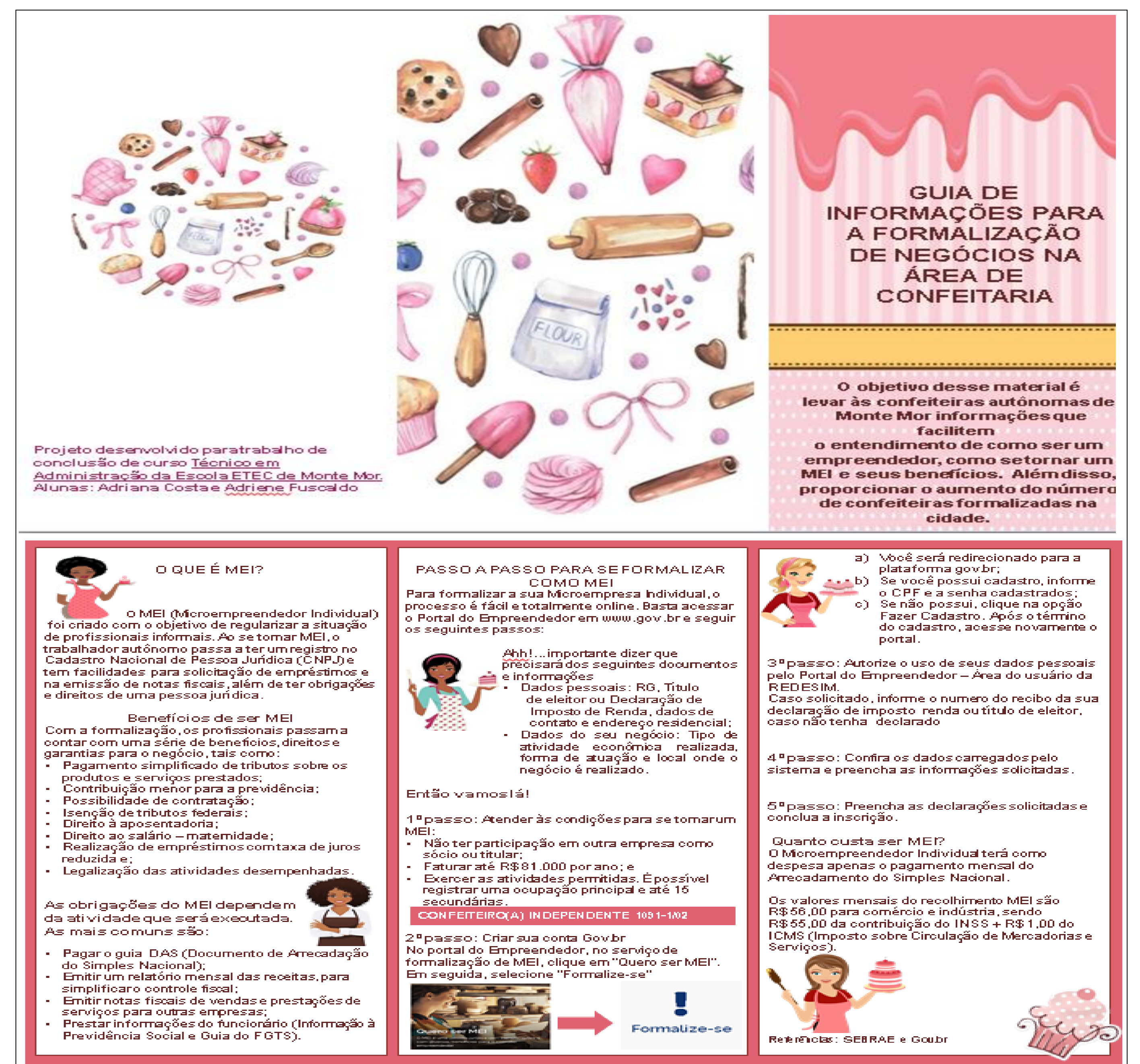
IMAGEM 1 – Guia de Informações- modelo Folder.

Sendo assim, desenvolvemos o guia com o intuito de levar às confeiteiras autônomas de Monte Mor informações que facilitem o entendimento de como ser um empreendedor, passo a passo de como se tornar um MEI e seus benefícios.