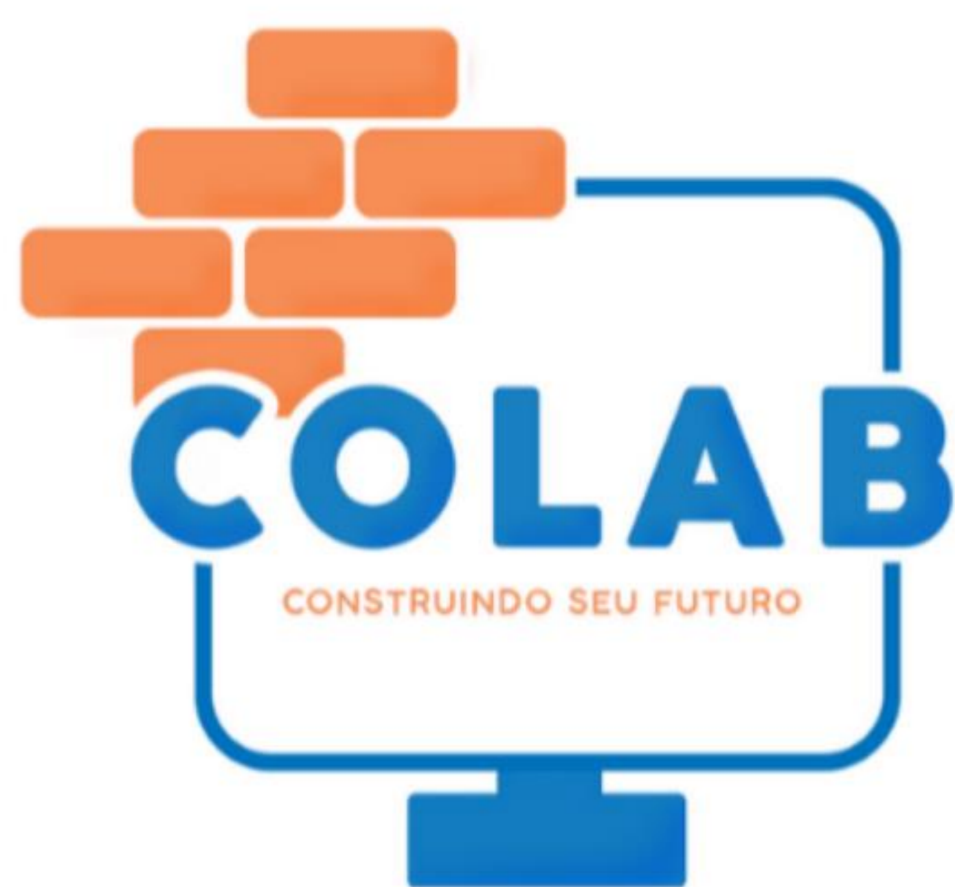
Logomarca do laboratório – Autor Leandro Assis

Uma das primeiras etapas na aplicação da metodologia foi a criação da identidade visual, que foi realizado por meio de um concurso que envolvia toda a comunidade escolar, tendo um vencedor que ganhou com sua logomarca por meio dos votos, que foi a logomarca representada na imagem abaixo, assim foi definido que o laboratório de aprendizagem a partir daquele momento seria chamado de COLAB.