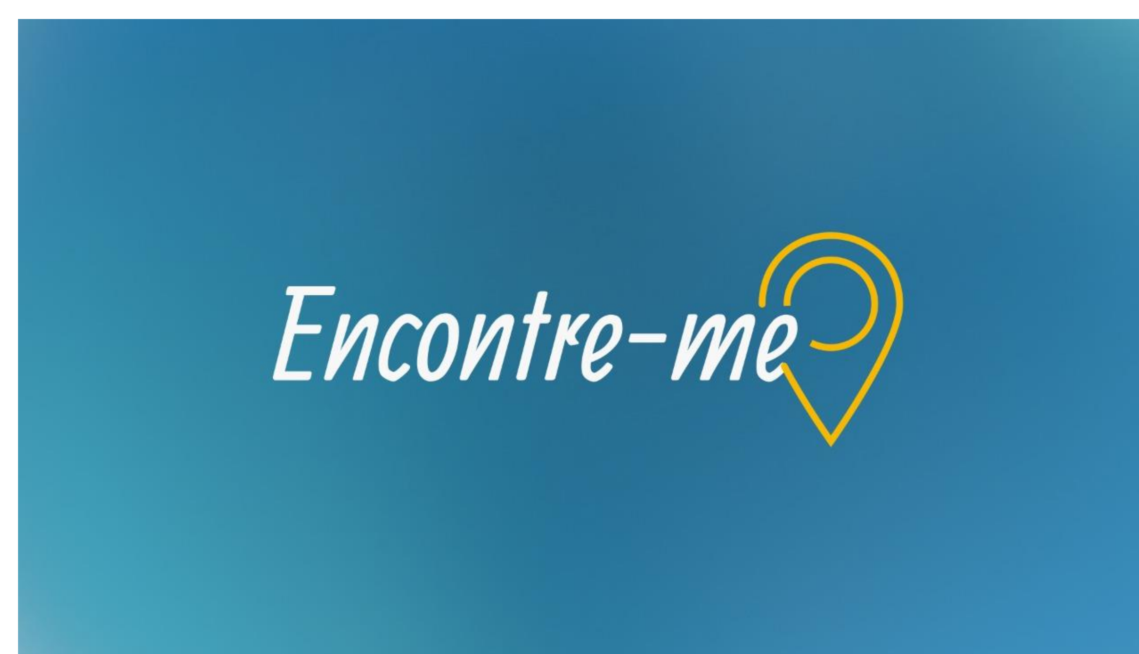
Figura 3: logo, fonte: Autoria própria