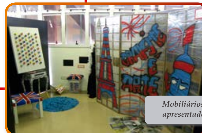
Mobiliários da Etec Albert Einstein, apresentados na Exposedesign