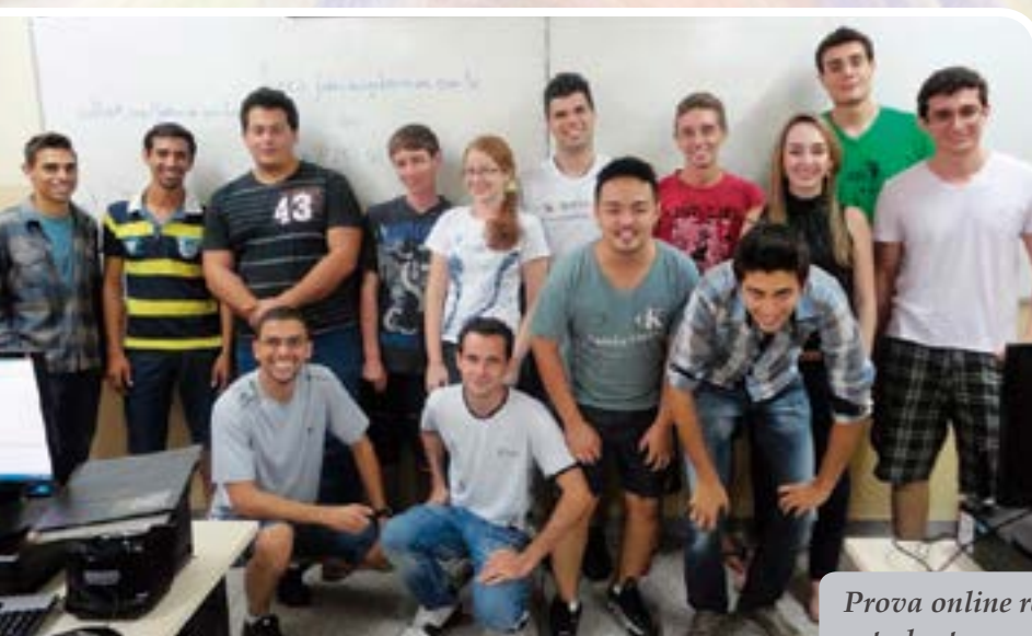
Prova online reúne estudantes em Mogi das Cruzes

Acontece em agosto na Fatec Mogi das Cruzes a etapa presencial da 2ª Maratona de Programação InterFatecs, voltada a talentos da área de computação. Para essa edição, se inscreveram 560 alunos de 29 Fatecs – entre as 40 unidades que oferecem cursos de graduação tecnológica do eixo tecnológico de Informação e Comunicação. Em maio, os competidores participaram de uma prova online que selecionou 43 equipes com cerca de 130 alunos para a disputa final.