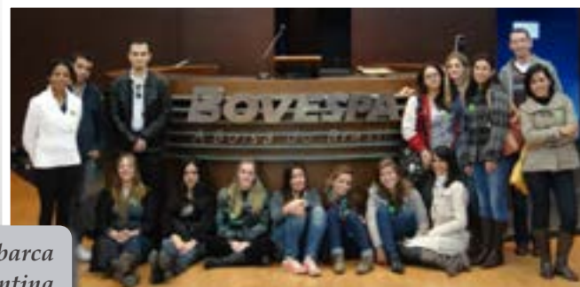
Em outubro, grupo embarca para Buenos Aires, na Argentina

Quatorze alunos do curso de Comércio Exterior da Fatec Indaítuba visitaram a BM&F Bovespa, em São Paulo, considerada a maior bolsa da América Latina e a terceira maior do mundo. Durante a atividade, realizada em maio, eles conheceram o Centro de Memória da instituição que narra a história do Brasil e do mercado de capitais. E também receberam instrução sobre diversos assuntos, como as operações de compra e venda de ações, as alternativas de investimentos, os giros de negócios e o funcionamento do mercado de classe. O objetivo da ação foi preparar os estudantes para uma visita à bolsa da cidade de Buenos Aires. A viagem deve acontecer em outubro por meio do projeto “Intercâmbio Brasil-Argentina: uma proposta cultural de negócios”, realizado pelo terceiro ano consecutivo pela comunidade acadêmica da Fatec.