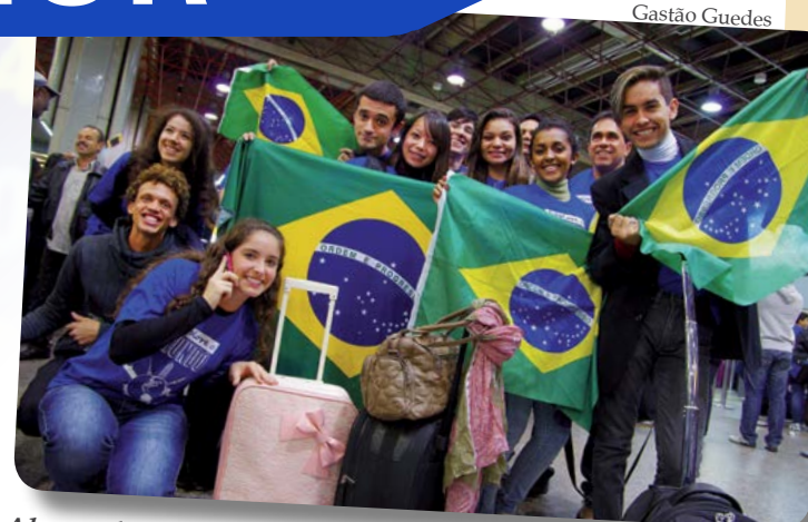
Alunos da primeira leva do Intercâmbio 2013 embarcam para Chicago no Aeroporto Internacional de Guarulhos, São Paulo

C omeçou o Intercâmbio Cultural do Centro Paula Souza 2013, que levará mais de 500 alunos de Etecs e Fatecs para estudar inglês gratuitamente nos Estados Unidos, Inglaterra e Nova Zelândia. Ao todo, 255 intercambistas viajam no primeiro semestre. Em abril, aconteceu o embarque da primeira turma para Chicago, que também recebe outro grupo em maio. Mais quatro turmas viajarão em junho para as cidades americanas de Boston, São Francisco, Rancho Palos Verdes e Glendora. Outras duas turmas também irão para Nova Zelândia e Inglaterra neste primeiro semestre.