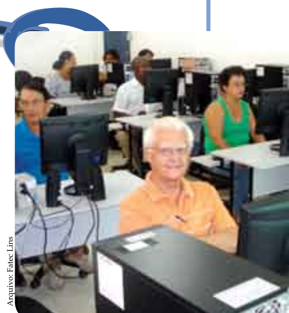
Alunos durante aula de informática na Fatec Lins