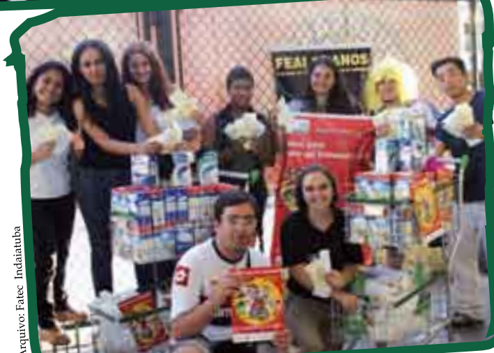
Alunos da Fatec Indaiatuba exibem as doações que conseguiram arrecadar instituições assistenciais