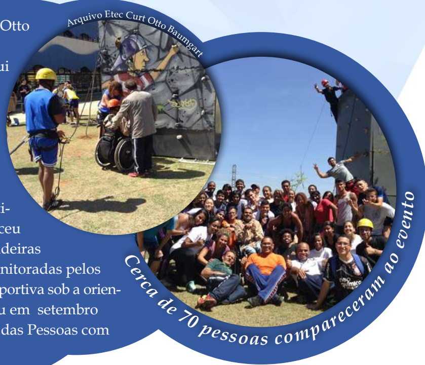
Cerca de 70 pessoas compareceram ao evento

A Etec de Esportes - Curt Walter Otto Baumgart, na capital paulista, realizou em setembro o 1º Incluir Etec. O evento, voltado a pessoas com deficiência, ofereceu a prática de esportes radicais adaptados para esse público. Os participantes vieram de instituições e escolas que trabalham com esses alunos. A programação incluiu modalidades como rapel, tirolesa, escalada, trampolim acrobático e slack line. Na ocasião, a unidade ofereceu também a prática de jogos coletivos, brincadeiras e ritmos de dança. As atividades foram monitoradas pelos alunos do curso técnico em Organização Esportiva sob a orientação de professores. O Incluir Etec aconteceu em setembro em comemoração ao Dia Nacional de Luta das Pessoas com Deficiência, celebrado dia 21.