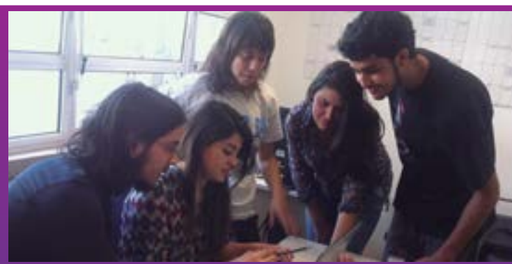
Equipe da Etec prepara argumento do curta