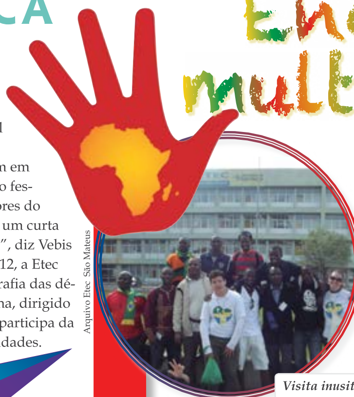
Visita inusitada rende experiência de vida aos alunos de São Mateus

No mês de julho, a Etec São Mateus (Capital) recebeu uma delegação de peregrinos vinda do Quênia e da Zâmbia, países africanos. O grupo passou pela Capital paulista antes de acompanhar a Jornada Mundial da Juventude, que aconteceu na cidade do Rio de Janeiro, e a vinda do papa Francisco ao Brasil. A visita teve o apoio da comunidade local da Pastoral São Paulo Apóstolo. A visita proporcionou aos estudantes da Etec a chance de treinar o inglês e trocar informações sobre o sistema educacional e os aspectos culturais de cada país.