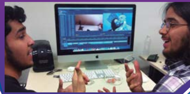
Integrantes do grupo editam o material