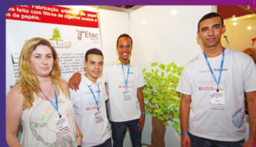
Estudantes apresentaram o projeto Sementuca durante a Feteps, em São Paulo

▶ PARA SABER MAIS: www.cpscetec.com.br/premioeseg