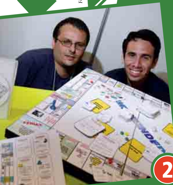
Alunos apresentam projetos nos stands da Feira Tecnológica do Centro Paula Souza