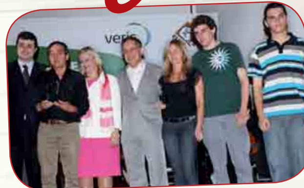
Alunos são reconhecidos pelo excelente resultado obtido no Enem

As Etecs que conquistaram as melhores médias no Exame Nacional do Ensino Médio (Enem) foram homenageadas, em outubro, durante a “Premiação Enem – Centro Paula Souza”, organizada pelo quinto ano consecutivo pela Veris Faculdades – instituição que unifica as marcas IBTA, Metrocamp, Uirapuru e Imapes e parte do Grupo Ibmecc Educacional. A cerimônia, realizada em parceria com o Portal Click Ideia, é uma maneira de reconhecer o talento dos alunos e a qualidade do ensino ministrado nas Etecs. Ao todo foram premiadas 34 Etecs com média superior a 626 na última edição do Enem e quatro Etecs do setor agropecuário com média superior a 603 pontos. O evento também contou com as apresentações do Coral do Centro Paula Souza e da Orquestra Filarmônica da Etec Fernando Prestes (Offep), de Sorocaba.