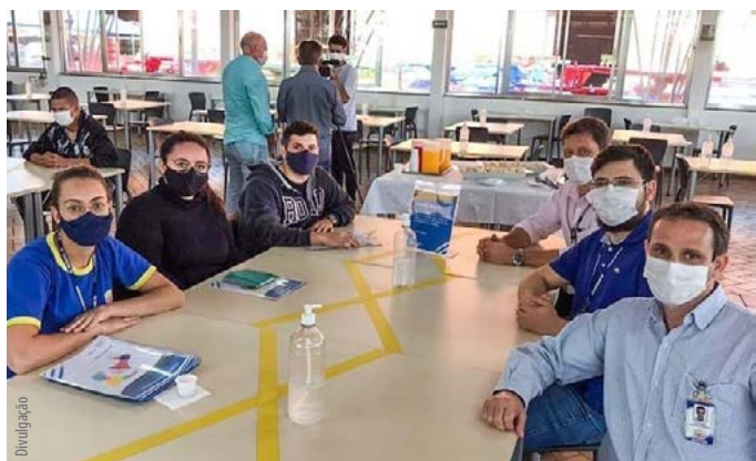
Estudantes e professores discutem as soluções com equipes das empresas

participa dos processos de avaliação do desempenho dos estudantes”, acrescenta ela.