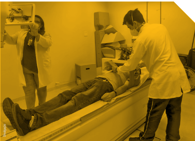
Alunos do curso superior de tecnologia em Radiologia da Fatec de Botucatu atuam no HC da Unesp