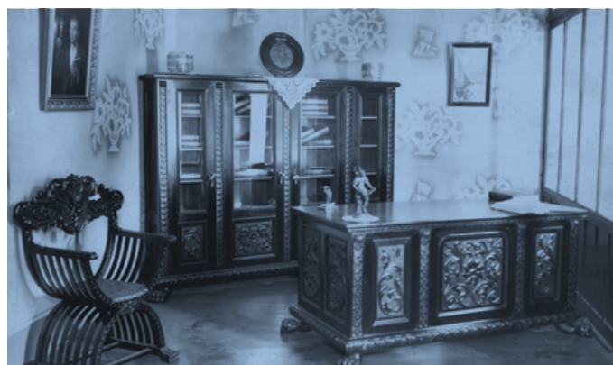
Móveis - Etec João Belarmino, Amparo