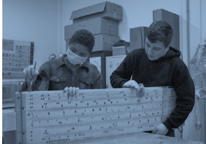
Etec José Rocha Mendes, São Paulo