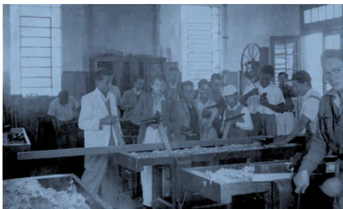
Aula de carpintaria

Ainda em construção, na fase de coleta de dados e reformulação do sistema digital, o Museu Virtual se tornará um espaço paralelo de relação do patrimônio cultural do Centro Paula Souza com os usuários e com a sociedade. Para saber mais sobre o projeto Memórias e História da Educação Profissional e Tecnológica: www.memorias.cpsctec.com.br . ■