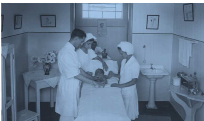
Aula de puericultura