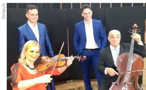
Inauguração do estúdio de gravação da Fatec Tatuí, em fevereiro de 2020

Esta Revista é uma publicação do Centro Paula Souza, vinculado à Secretaria de Desenvolvimento Econômico do Estado de São Paulo