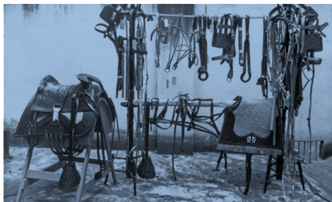
Etec João Belarmino, Amparo