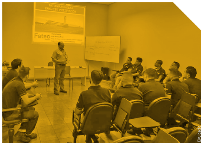
Na Fatec Matão, todos os estudantes passam pelas práticas do Projeto Integrador

Em Matão, uma nova unidade de Fatec foi criada, em 2019, com o intuito de atender às demandas do arranjo produtivo local. E o curso inaugural, Análise de Processos Agroindustriais, já começou com um diferencial: todos os alunos passam pelo Projeto Integrador, no qual os jovens têm a tarefa de pensar em soluções para necessidades corporativas reais.