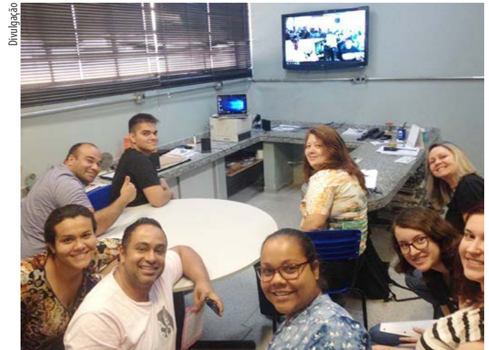
Estudantes da Fatec Piracicaba em atividade online com holandeses