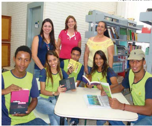
Professoras orientam alunos nas pesquisas, em Dracena