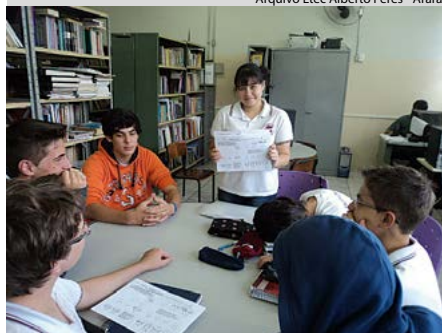
Alunos em atividades na biblioteca

Atividades inovadoras surgiam com frequência. Nas turmas da manhã, o engajamento dos alunos foi expressivo, na formação de grupos de teatro, contação de histórias, oficina de desenho, entre outras atividades. Os estudantes dos cursos técnicos noturnos também aproveitaram muito a biblioteca, tanto para pesquisas e elaboração de trabalhos de conclusão de curso como para a leitura de notícias e artigos técnicos em jornais, revistas e em portais na internet. Durante os intervalos, os alunos também utilizavam na biblioteca jogos como xadrez, dama e quebra-cabeça, que favorecem o desenvolvimento do raciocínio e a integração.