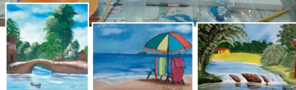
Após pesquisar movimentos nas artes, alunos praticam pintura em vários estilos