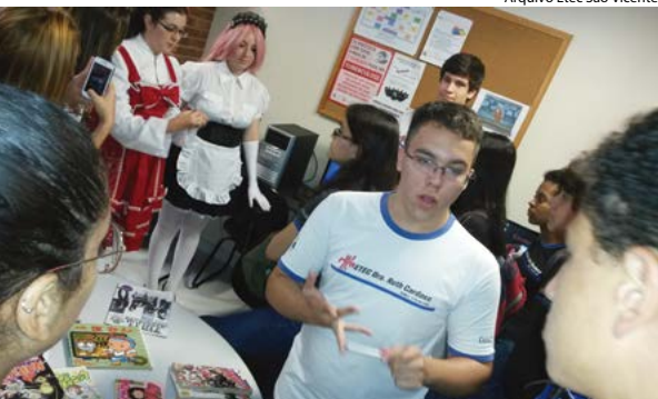
Cordel e mangás: diversidade nas pesquisas de alunos da Etec de São Vicente