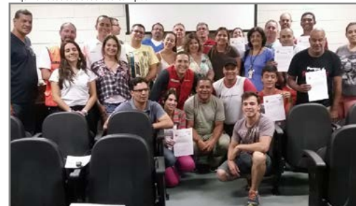
Curso foi bem avaliado pela turma