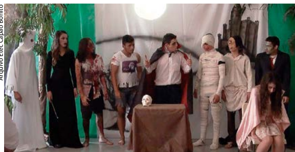
Criação de peça teatral em Capão Bonito

estilo e a exposição de histórias e gravuras criadas pelos estudantes. Também realizou a Mostra Cultural Pop Japonesa, com pesquisas e trabalhos sobre mangás e debates sobre os “animes” (animações produzidas também no Japão).