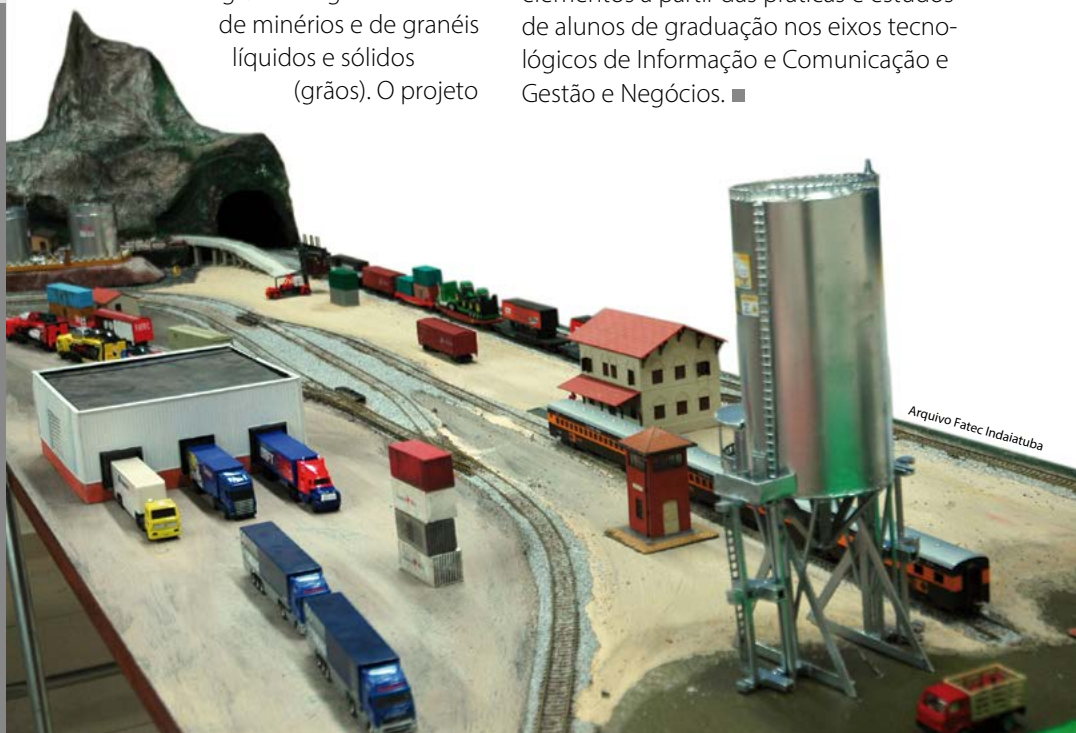
Arquivo Fatec Indaiatuba