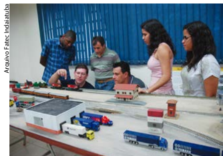
Atividades práticas já começaram