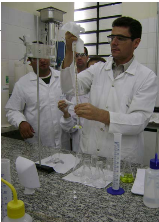
Atividades práticas nos laboratórios dos cursos de Alimentos e Agroindústria da Etec Sapopemba (capital), da Fatec Marília e da Fatec Piracicaba

paro de matérias-primas de origem vegetal e animal, bem como o processo de conservação e armazenamento desses insumos. Cuida da higiene na produção e implanta procedimentos de qualidade. Para aprender todas essas funções na prática, os alunos contam com laboratórios de microbiologia e bioquímica; processamento de leite e derivados; de carnes; de frutas e vegetais.