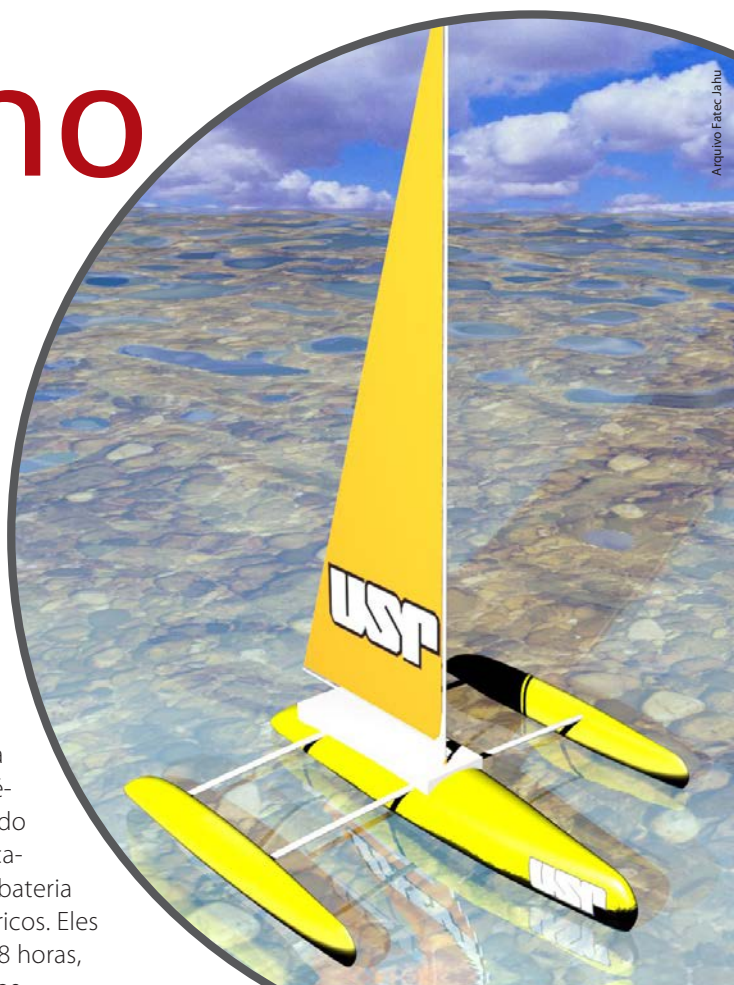
Entre outras aplicações, o barco vai ajudar na verificação da qualidade das águas

Segundo Amorim, outra possibilidade é usar o barco para conferir periodicamente o estado da estrutura de pilares de pontes. “No Rio Tietê, por exemplo, há comboios que carregam grãos e, no ano que vem, a Transpetro vai transportar combustível. Às vezes ocorrem colisões