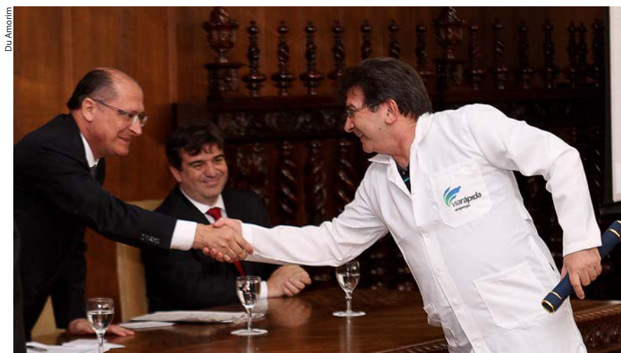
Governador cumprimenta formando pelo programa Via Rápida Emprego

O Governo de São Paulo investiu mais de R$ 149 milhões no programa. O Centro Paula Souza prevê inicialmente R$ 22 milhões para sua participação: R$ 6,4 milhões aplicados em seis unidades móveis que levam a formação profissional pelo Estado, e outros R$ 16 milhões para as futuras unidades fixas do Via Rápida. A lista completa dos cursos e as inscrições estão no site www.viarapida.sp.gov.br . Para participar, basta ter no mínimo 16 anos, ser alfabetizado e residir no Estado de São Paulo. ■