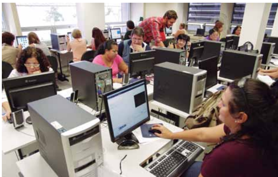
Capacitação de professores sobre uso de multimídia na sala de aula