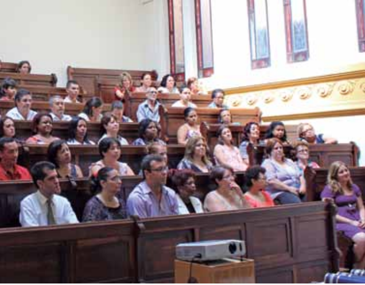
Servidores do Centro Paula Souza em curso técnico a distância (Telecurso TEC)

fissionalizantes são oferecidos também para jovens em medidas socioeducativas na Fundação Casa. Somando todas as iniciativas do Via Rápida, no primeiro semestre de 2012, o Centro Paula Souza deve oferecer 15.470 vagas entre as unidades móveis e os postos fixos.