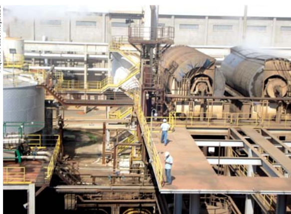
Alunos fazem visita técnica à ETH Bioenergia