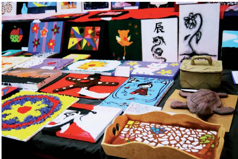
Mosaicos produzidos por alunos da Etec Ribeirão Pires