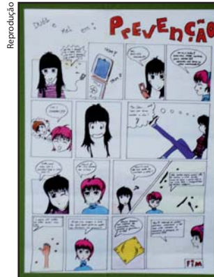
Reprodução História em quadrinhos da Etec Antônio Devisate, de Marília, recebe o 1º lugar

A professora e a aluna ganharam uma viagem ao Rio de Janeiro, onde receberam o prêmio. ■