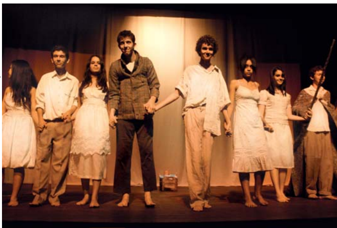
Morte e Vida Severina, apresentada pela Etec Dr. Júlio Cardoso, de Franca