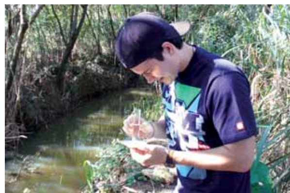
Outro projeto da Fatec Indaiatuba é a análise da água do córrego Barrinha, feita mensalmente