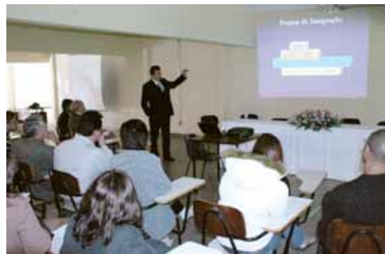
Professores assistem à apresentação dos módulos do Sistema de Gestão Acadêmica na Etec Benedito Storani