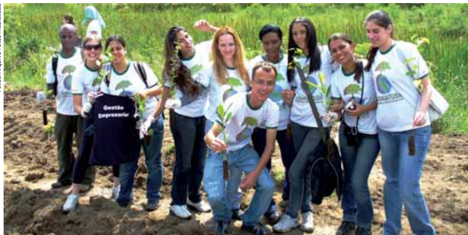
Fatec Indaiatuba quebrou recorde mundial no plantio de árvores, em novembro de 2008

Estudantes de Informática passam as informações para o computador. À medida que o levantamento de cada bairro fica pronto, os dados seguem para a Secretaria do Meio Ambiente do município, que desta forma planeja o plantio e reposição de árvores.