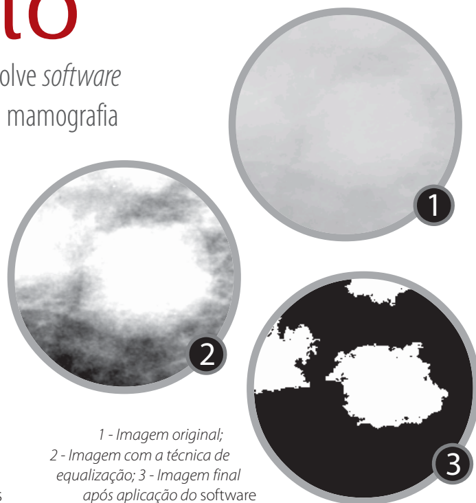
1 - Imagem original; 2 - Imagem com a técnica de equalização; 3 - Imagem final após aplicação do software

O câncer de mama é o segundo tipo mais frequente no mundo e o mais comum entre as mulheres, causando mais mortes na população feminina.