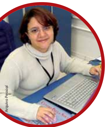
Imagem ponto por ponto

Professora da Fatec Botucatu desenvolve software que vasculha cada pontinho de uma mamografia